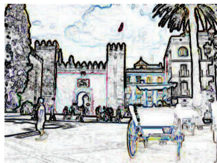
Acceso por el Patio de Banderas (Puerta del Apeadero)

Plano de situación para el acceso al cóctel de bienvenida. Reales Alcázar de Sevilla. 14 de junio. 21:00 horas.